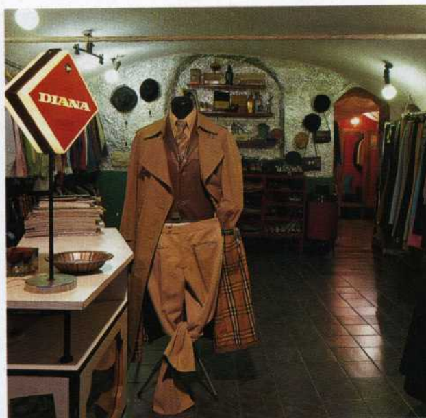
A sinistra , Almanacco, storico negozio di abbigliamento usato e vintage, in via Macelli di Soziglia 41r. Sotto , Compagnia unica, uno spazio in via San Lorenzo, specializzato in abbigliamento firmato che vende firme come Prada e Miu Miu.