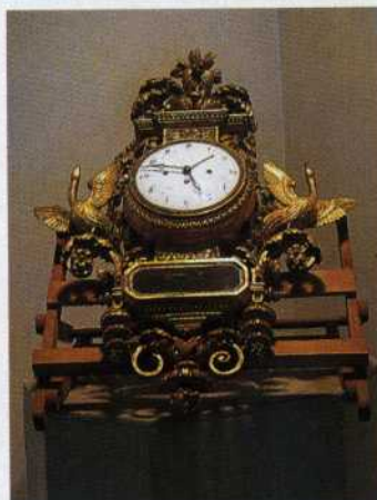
Sopra , un bellissimo orologio scultura e, a destra , la galleria d'antiquariato Wanennes in via Garibaldi.